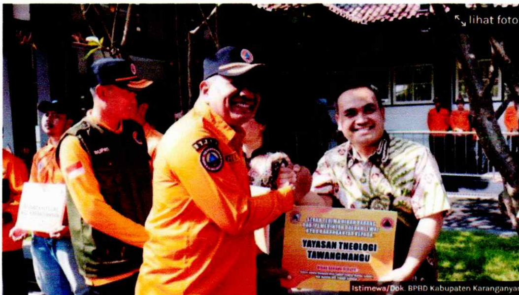
BPBD Kabupaten Karanganyar memberikan bantuan kepada masyarakat berupa hibah peralatan secara simbolis di apel Kesiapsiagaan di kompleks Setda Kabupaten Karanganyar, Jumat (26/4/2024).

Penulis: Mardon Widiyanto | Editor: Vincentius Jyestha Candraditya