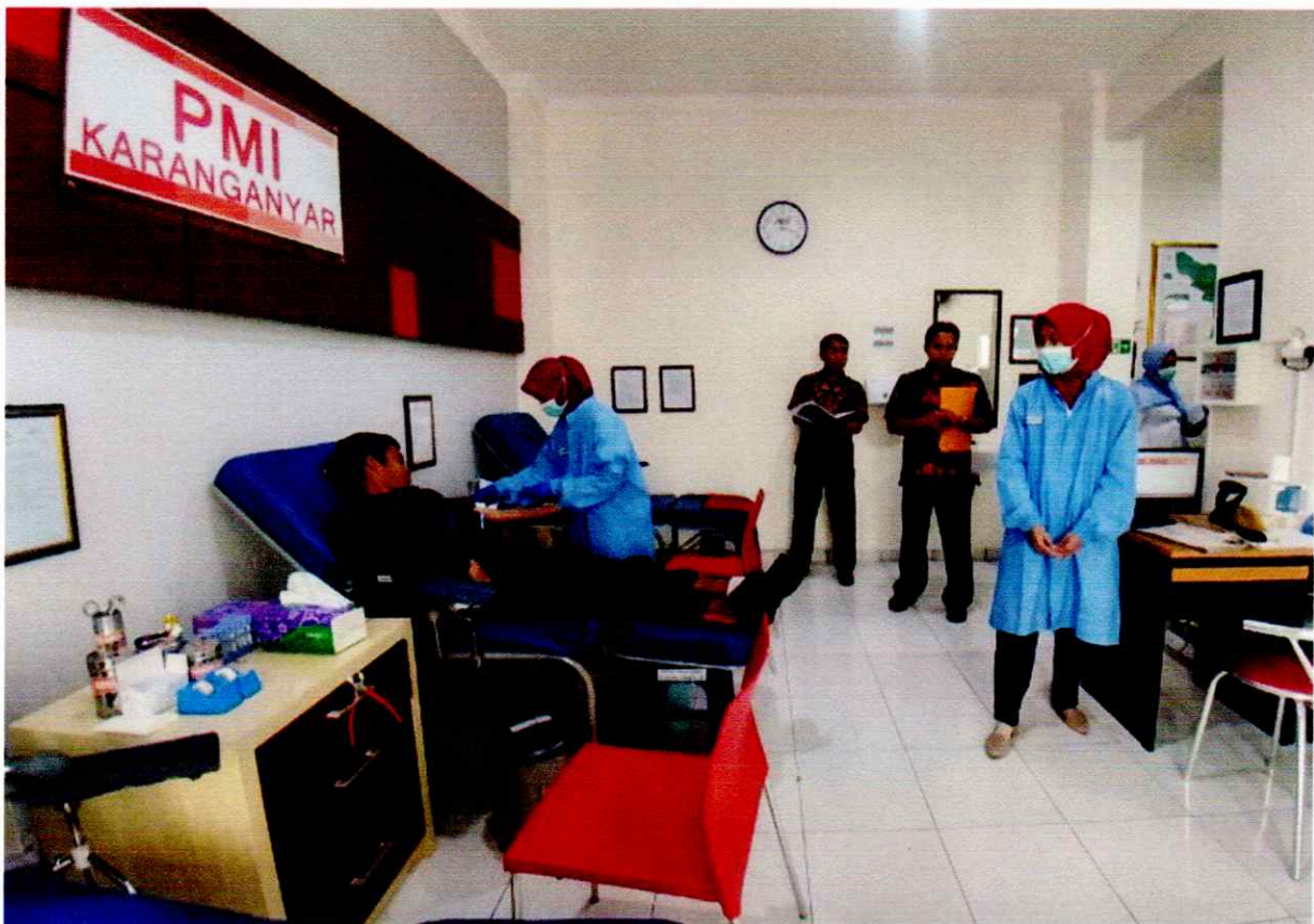
Markas PMI Kabupaten Karanganyar merupakan Aset milik Pemerintah kabupaten Karanganyar yang digunakan untuk operasi dan Pelayanan PMI Kabupaten Karanganyar